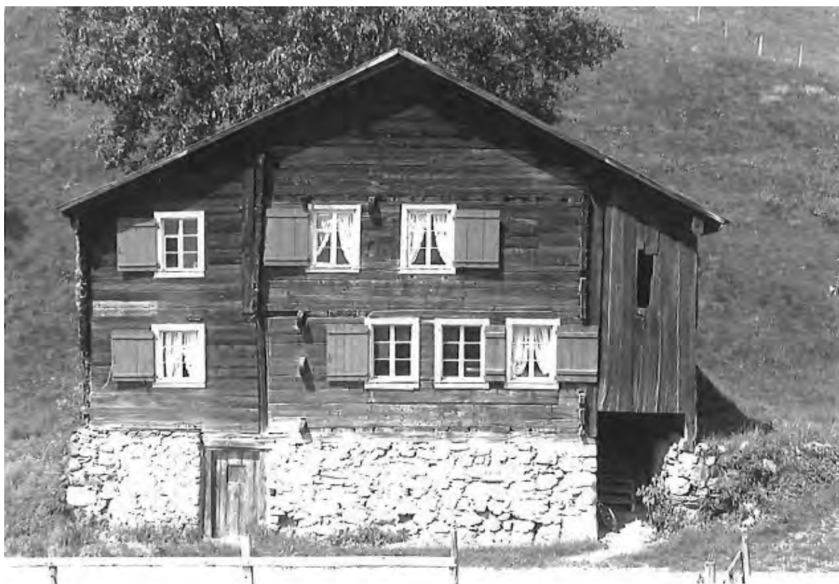
HAUS TANNEN, AM WEG DER SCHWEIZ, MORSCHACH SZ