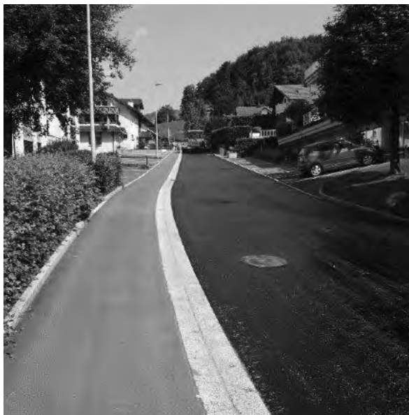
LAUFENDE DECKBELAGSARBEITEN AN DER AXENSTEINSTRASSE

Im gesamten Sanierungsperimeter konnte im Juni 2017 der Deckbelag zwischen der alten Post und der Brücke Rütliblick erfolgreich eingebaut werden. Im Strassenbereich wurden teilweise Wasser- sowie Abwasserleitungen erneuert.