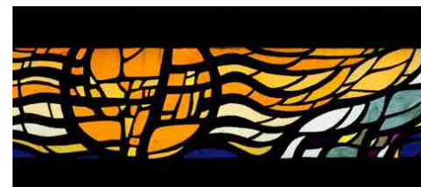
Antoniuskapelle Mattli, Sonnengesang