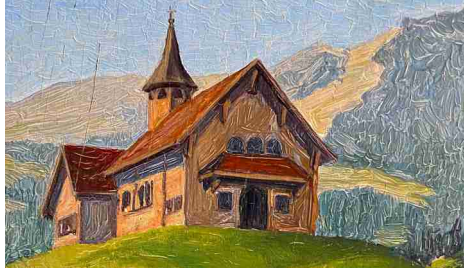
Ex Voto-Bild, Stooskapelle